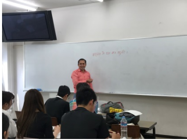
外国人の先生の授業