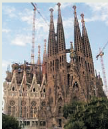
聖家族教会(バルセロナ)